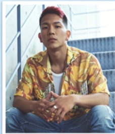
KENGO REG☆STYLE/FLY DIGGERZ