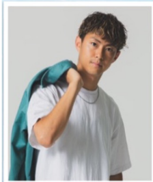
KSY FLY DIGGERZ